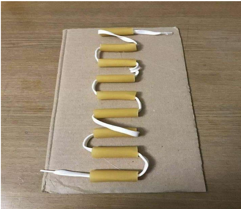
Rysunek 2 rysunek pobrany z Internetu dnia 14.04.2020