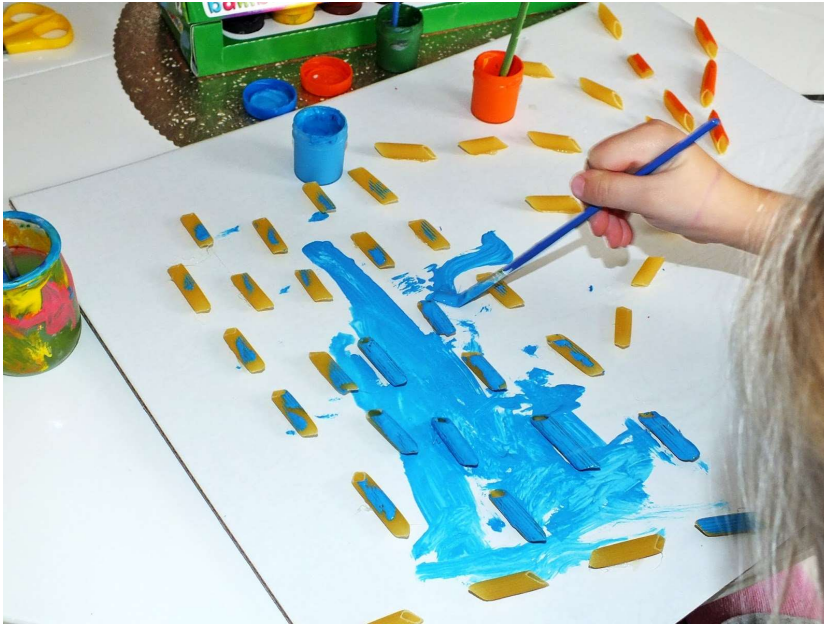
Rysunek 1 rysunek pobrany z Internetu dnia 14.04.2020